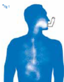
Inhalace přímo z dávkovacího inhalátoru Léčivo může ulpívat v ústech, krku, žaludku a zapříčinit výskyt vedlejších účinků.

Inhalační nástavec s antistatickou komorou konstruován k maximálnímu využití léčiva při aplikaci pomocí pMDI v plicích.